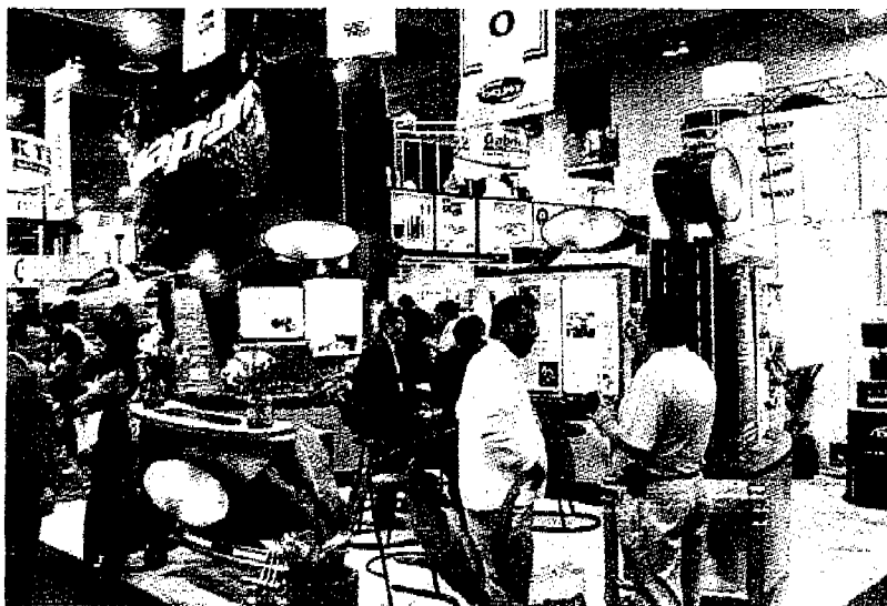
► El Centro Banamex recibirá a las compañías de autopartes.

La exposición contará con la participación de empresas provenientes de Alemania, Brasil, Canadá, China, España, Estados Unidos, Hong Kong, India, Malasia, México, Taiwán y Turquía, además de 100 autos tuning. Está dirigida principalmente a plantas armadoras, autopartes, distribuidores, talleres, académicos y estudiantes.